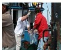
Trabalhos a bordo [89Kb]