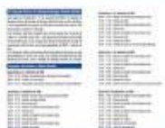
Folheto 2/4 [371Kb]