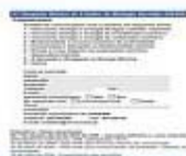
Folheto 3/4 [226Kb]