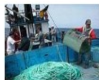
Trabalhos a bordo [111Kb]