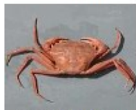
Caranguejo da fundura [52Kb]