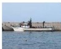
N/P "Baía de Câmara de Lobos" [42Kb]