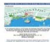
Folheto 4/4 [228Kb]