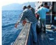
Trabalhos a bordo [105Kb]