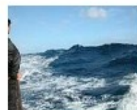
Estado do mar [77Kb]