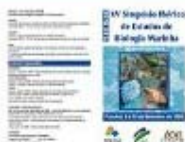
Folheto 1/4 [418Kb]